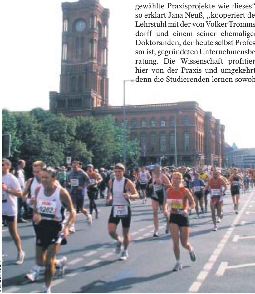
Der jährliche Berlin-Marathon zieht nicht nur viele Läufer an, sondern auch Touristen

Die Basis dieser Studie war eine Praxisübung im Sommersemester 2005. Mit 24 Studierenden, hauptsächlich Betriebswirtschaftlern, aber auch zwei Wirtschaftsingenieuren und ei-