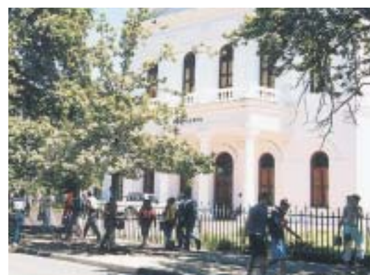
Das Hauptgebäude wurde 1886 für das Victoria College fertig gestellt, dem Vorläufer der Universität Stellenbosch

Die Universität Stellenbosch orientiert sich nicht nur in der Lehre auf die Zukunft, sondern hat auch in der For-