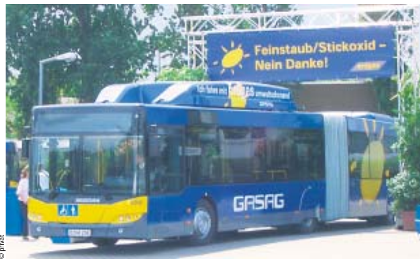
Idee aus dem TELLUS-Projekt: Ganze Firmenflotten, mit Erdgas betrieben, schonen die Umwelt

www.tellus-cities.net www.verkehrsplanung.tu-berlin.de