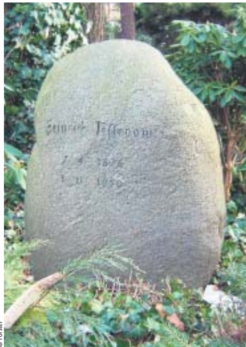
Heinrich Tessenows Grab auf dem Waldfriedhof Dahlem

Vor 130 Jahren, am 7. April 1876, wurde Heinrich Tessenow geboren, der als Philosoph unter den Architekten gilt. Im Herbst 1926 wurde er an die Technische Hochschule Berlin berufen. Einer seiner Schüler war Albert Speer. Obwohl er dessen Werk kritisch gegenüberstand, fiel ein Schatten auch auf ihn. Aber Tessenow gehörte wie Hans Poelzig oder Bruno Taut zu den Vertretern des „Neuen Bauens“. Ab 1933 galt er als Anhänger des „Kulturbolschewismus“. Heute scheint Tessenow vergessen, obwohl sein Werk manche aktuelle Überraschung birgt. Die Architektur hatte für ihn neben der ästhetischen immer auch eine soziale Komponente. Im Mittelpunkt seines Bauens und Lehrens stand stets der Mensch mit seinen Bedürfnissen. Effekt ohne Inhalt war im zuwider. Tessenow war ein Meister der Klarheit, Einfachheit und Würde der Form. Er entstammte einer Rostocker Handwerkerfamilie. Die traditionelle Handwerksarbeit lag ihm lebenslang am Herzen. Nach einer Zimmermannslehre im väterlichen Betrieb besuchte er 1896 bis 1898 die Bauschulen in Neustadt und Leipzig. 1899 schrieb er sich als Gasthörer an der TH München ein und verdiente sich den Lebensunterhalt im Architekturbüro Martin Düfler. Von 1902 bis 1905 unterrichtete er an mehreren Bauschulen und trat mit ersten Entwürfen in der Fachpresse in Erscheinung. Auf Empfehlung von Hermann Muthesius (TU intern 4/2005) erhielt er eine Lehrerstelle an der neuen Handwerks- und Kunstgewerbeschule