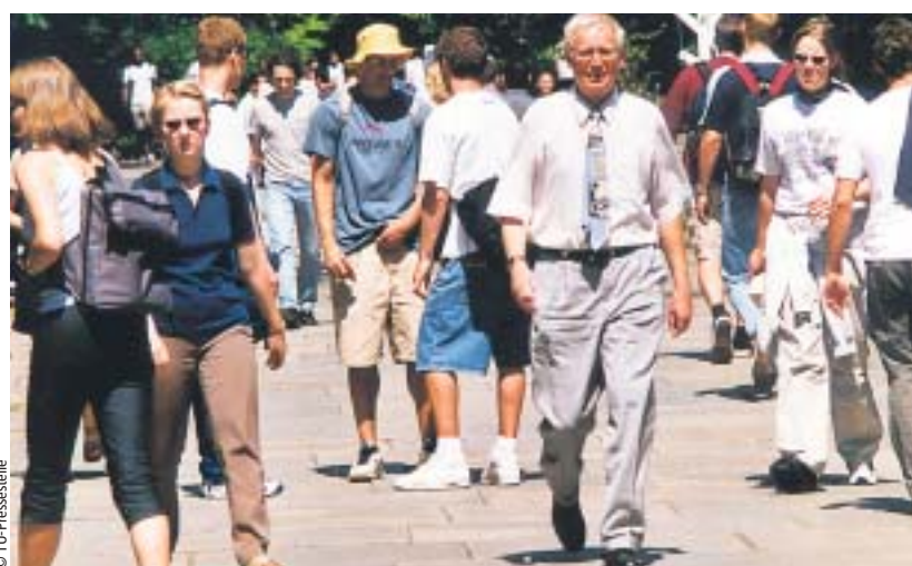
Bald werden einige zehntausend Studierende mehr in die Universitäten drängen

onal zu wettbewerbsschwach. Auch er sprach sich für neue Personal Kategorien wie Forschungsprofessuren auf Zeit oder Lehrprofessuren mit hohem Lehrdeputat sowie für „Fiebinger-Professuren“ aus. Auf Grundlage des Fiebinger-Plans wurden an den deutschen