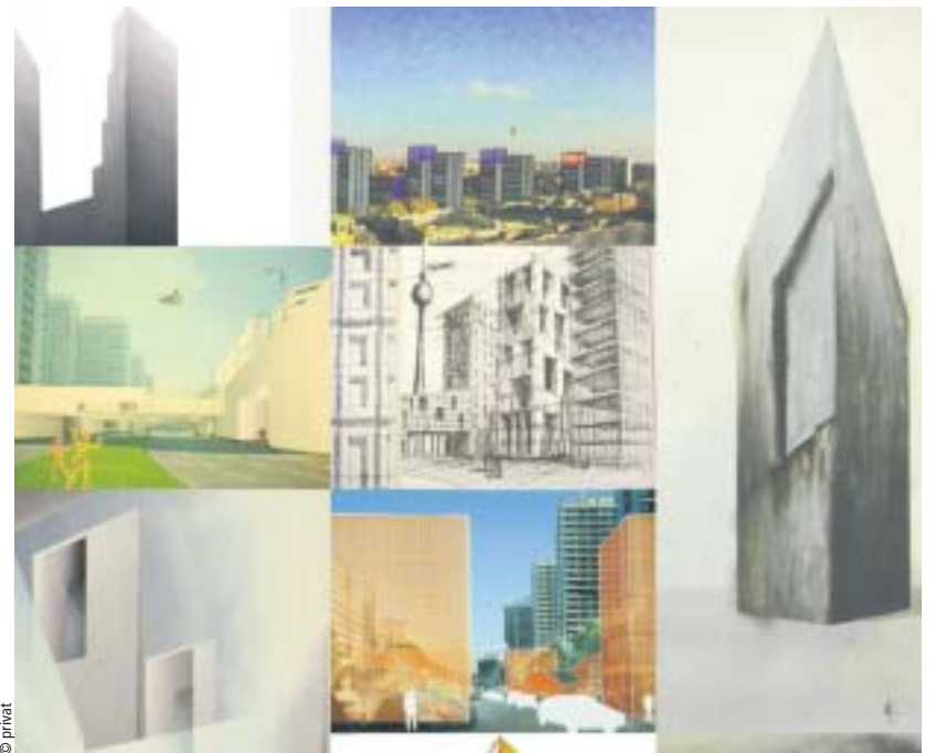
Während des Workshops entstanden interessante Ideen für die Leipziger Straße (Ausschnitt)